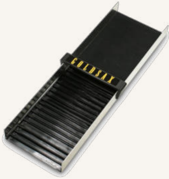
Scout 50 mit Omni-Catch Goldmatten von GoldSax